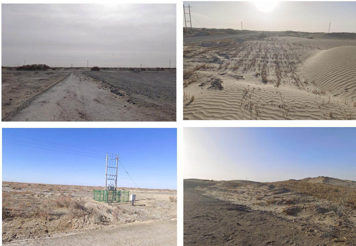
图 4.1-1 管线沿线恢复情况

本项目验收期间，对各类管线、道路的临时占地平整恢复、生态环境现状及现场建设情况进行了勘查，详见本项目临时占地及生态环境恢复现场照片。