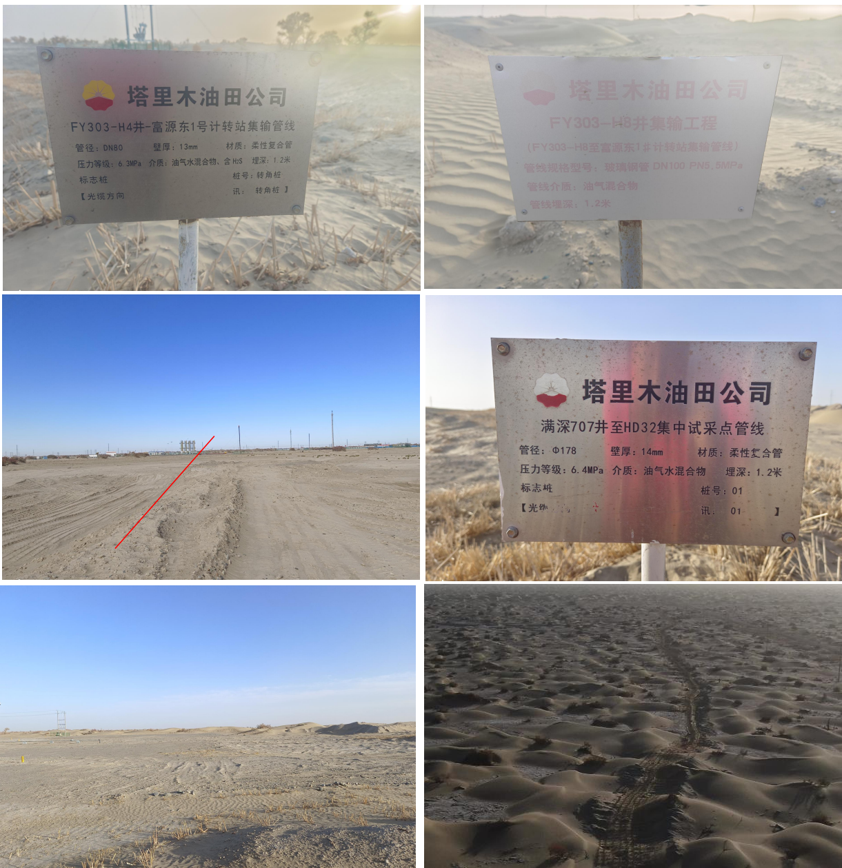
图 2.3-2 管线集输情况