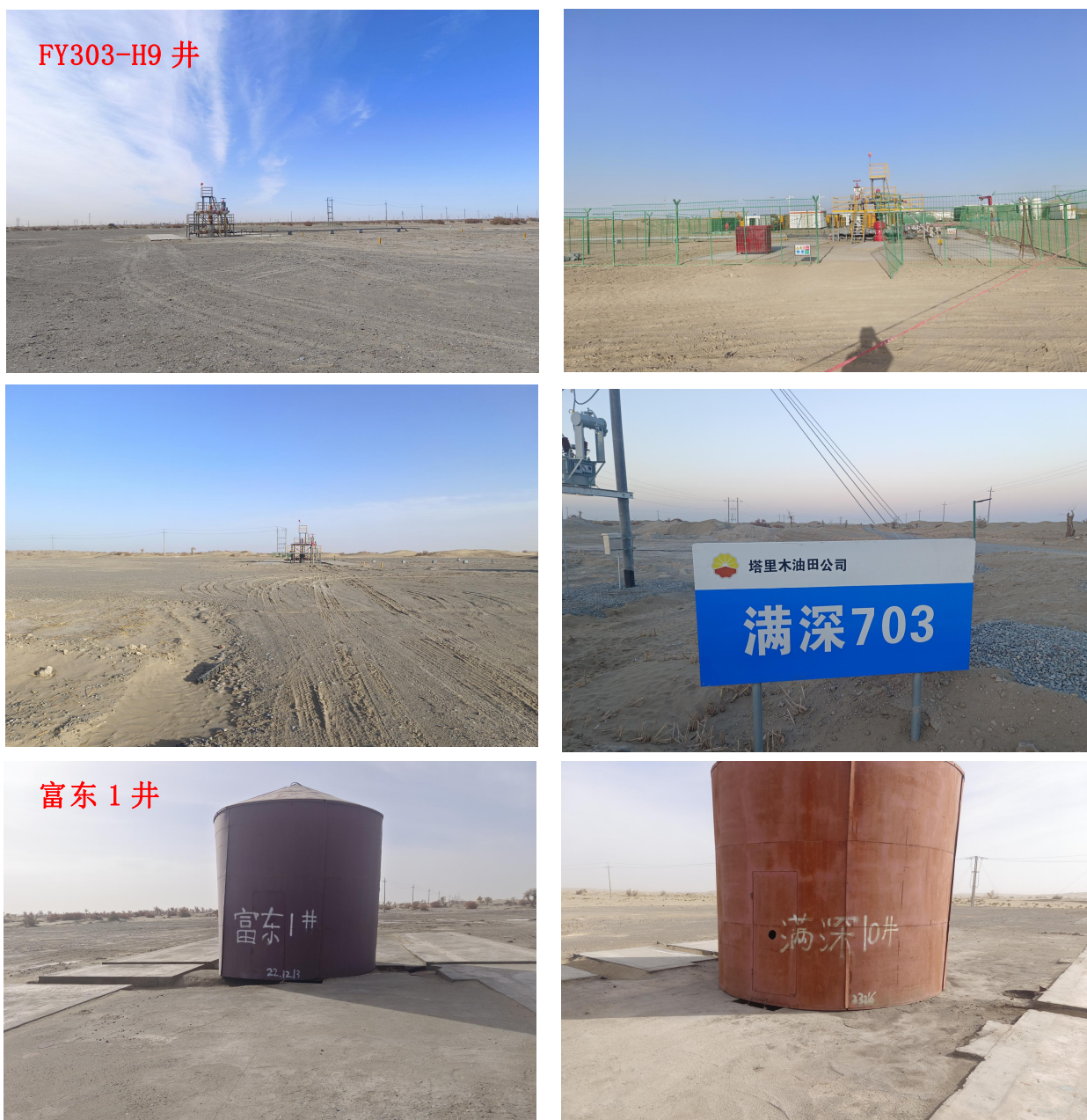
图 2.3-1 井场现场情况